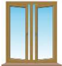
Таблица 8706-0101-04 - Оконные блоки из ПВХ профилей, двухстворчатые со стеклопакетом однокамерным, двухэлементные, с поворотной (откидной, поворотно-откидной) фурнитурой

Блоки оконные из ПВХ профилей толщиной 60 мм двухстворчатые одинарной конструкции со стеклопакетом однокамерным, с поворотной (поворотно-откидной) фурнитурой: двухэлементные с поворотно-откидными створками, доски подоконные из ПВХ профилей не ламинированные.