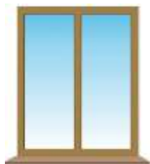
Таблица 8706-0101-03 - Оконные блоки из ПВХ профилей, двухстворчатые со стеклопакетом однокамерным, глухие

Блоки оконные из ПВХ профилей толщиной 60 мм двухстворчатые одинарной конструкции со стеклопакетом однокамерным, не открывающиеся: глухие, доски подоконные из ПВХ профилей.