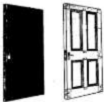
Таблица 8706-0201-03 - Дверные блоки наружные, однопольные, глухие блоки с трудновозгораемыми полотнами

-0301: Блоки дверные наружные, однопольные, глухие блоки с трудновозгораемыми полотнами ДС 16-9ГТП; ДС 19-9ГТП.