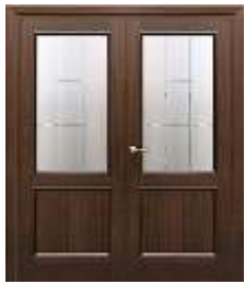
Таблица 8706-0202-04 - Дверные блоки двупольные во внутренних дверных проемах

Блоки дверные с двупольными глухими полотнами ДВГ 21-13П внутренние.