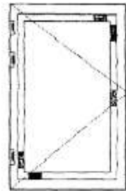
Таблица 8706-0204-01 - Дверные блоки из ПВХ в наружных и внутренних дверных проемах в перегородках

-0101: Блоки дверные из ПВХ профилей остекленные, однопольные, с заполнением однокамерными стеклопакетами.