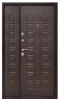
Таблица 8706-0201-04 - Дверные блоки наружные, двухпольные, усиленные, глухие блоки с трудновозгораемыми полотнами

-0402: Блоки дверные служебные с двухпольными трудновозгораемыми полотнами ДС 21-13ГТП с доводчиком дверным 4 класса.